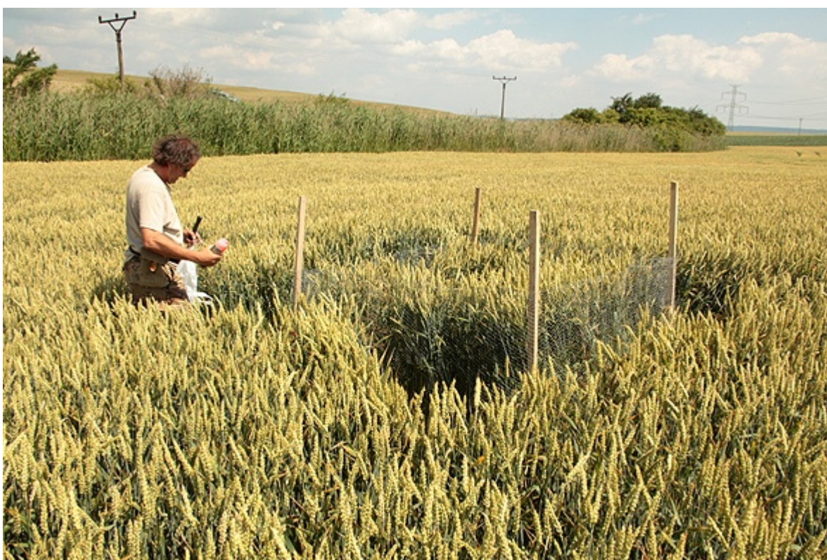
Příklad ochrany hnízda motáka lužního ( Circus pygargus ) na hnízdě v porostu pšenice. Horní Dubňany, hnízdo č. 391.