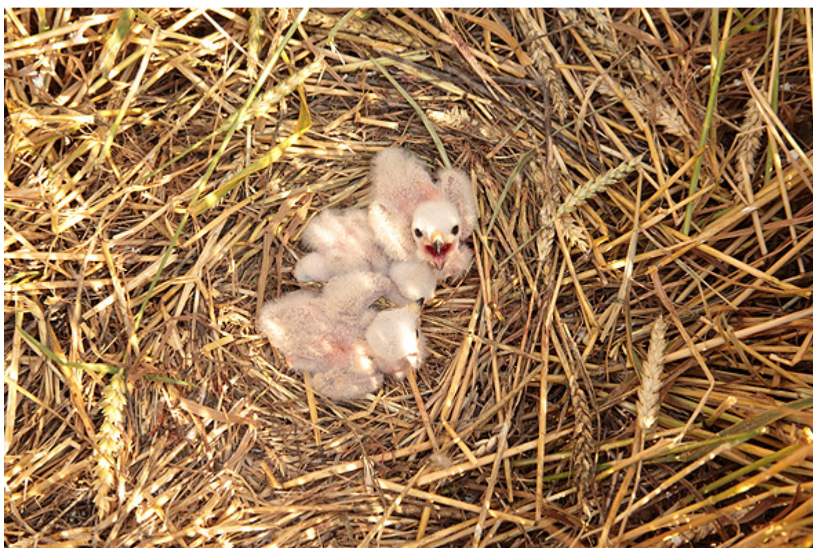
Mláďata motáka lužního ( Circus pygargus ) na oploceném hnízdě v porostu pšenice. Trstěnice, hnízdě č. 398.