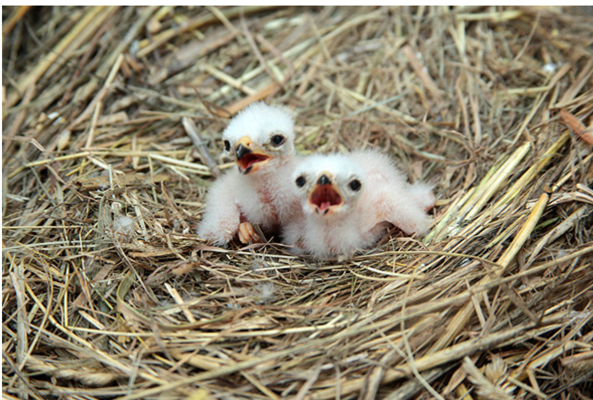
Mláďata motáka lužního ( Circus pygargus ) na oploceném hnízdě v porostu pšenice. Trstěnice, hnízdě č. 394. Foto: Karel Poprach, 2011.