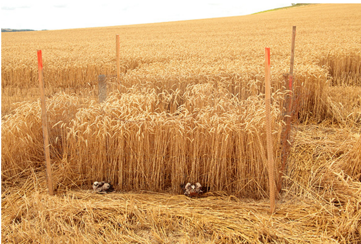
Příklad ochrany hnízda motáka lužního ( Circus pygargus ) na hnízdě v porostu pšenice. Trstěnice, hnízdo č. 398. Foto: Karel Poprach, 2011.