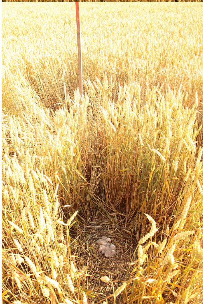
Mláďata motáka lužního ( Circus pygargus ) na oploceném hnízdě v porostu pšenice. Trstěnice, hnízdě č. 395.