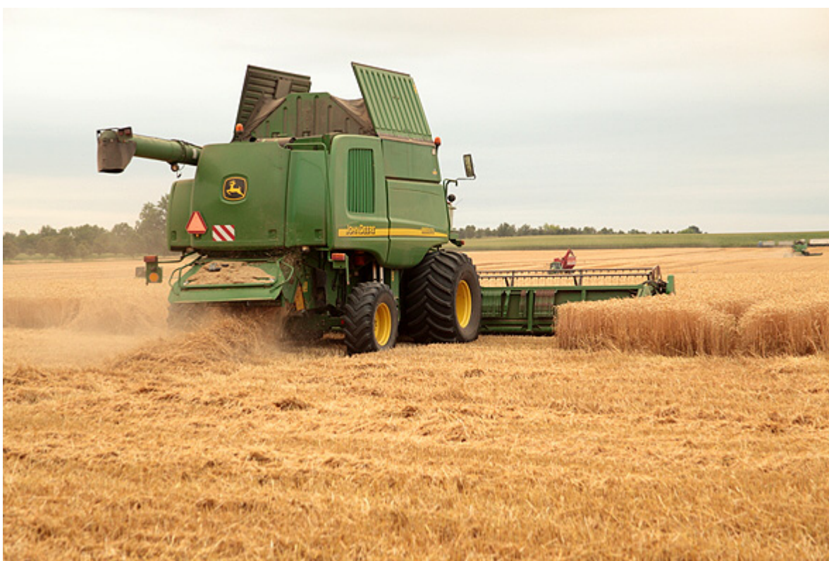
Průběh obsečení hnízda motáka lužního ( Circus pygargus ) na hnízdě v porostu pšenice během žní. Chlupice, hnízdo č. 390. Foto: Karel Poprach, 2011.