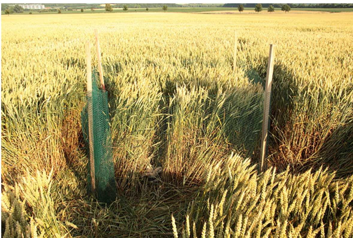
Příklad ochrany hnízda motáka lužního ( Circus pygargus ) na hnízdě v porostu pšenice. Chlupice, hnízdo č. 390.