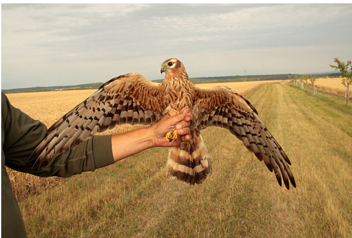
Hnízdící samec a samice motáka lužního ( Circus pygargus ) při kontrolním odchytu.