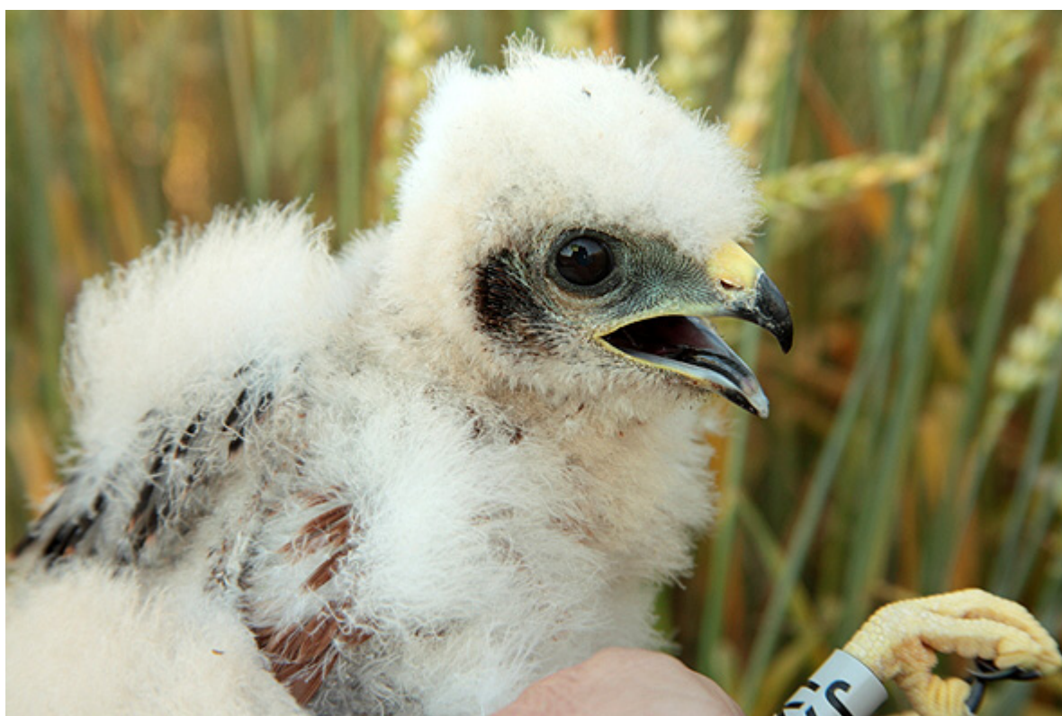
Mláďata motáka lužního ( Circus pygargus ) na oploceném hnízdě v porostu pšenice. Chlupice, hnízdě č. 390.