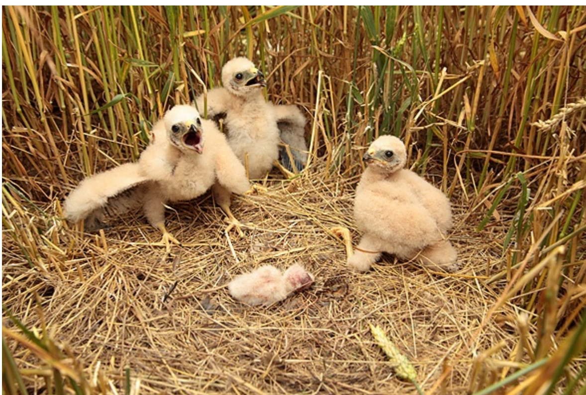
Mlád'ata motáka lužního ( Circus pygargus ) na oploceném hnízdě v porostu pšenice. Bantice, hnízdě č. 414. Foto: Karel Poprach, 2011.