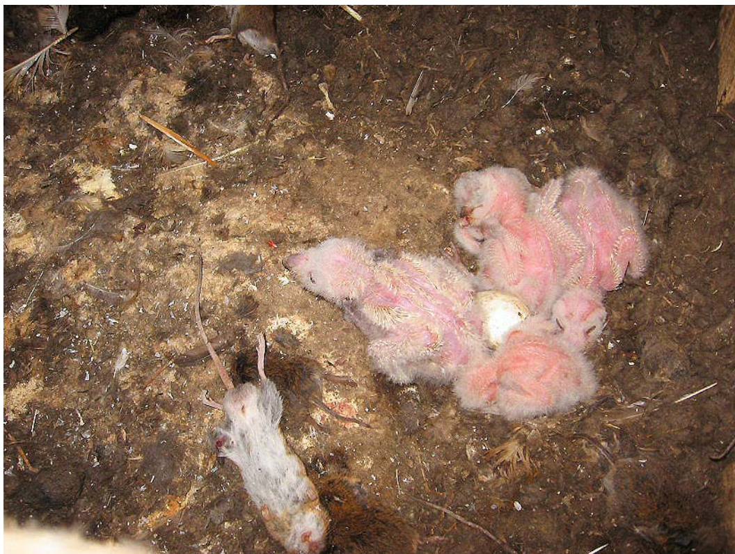
Čerstvě narozená mláďata sovy pálené ( Tyto alba ). Libčeves, 2009.