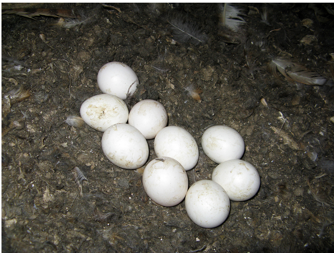
Snůška sovy pálené ( Tyto alba ), Panenský Týnec, okres Louny, 2010.