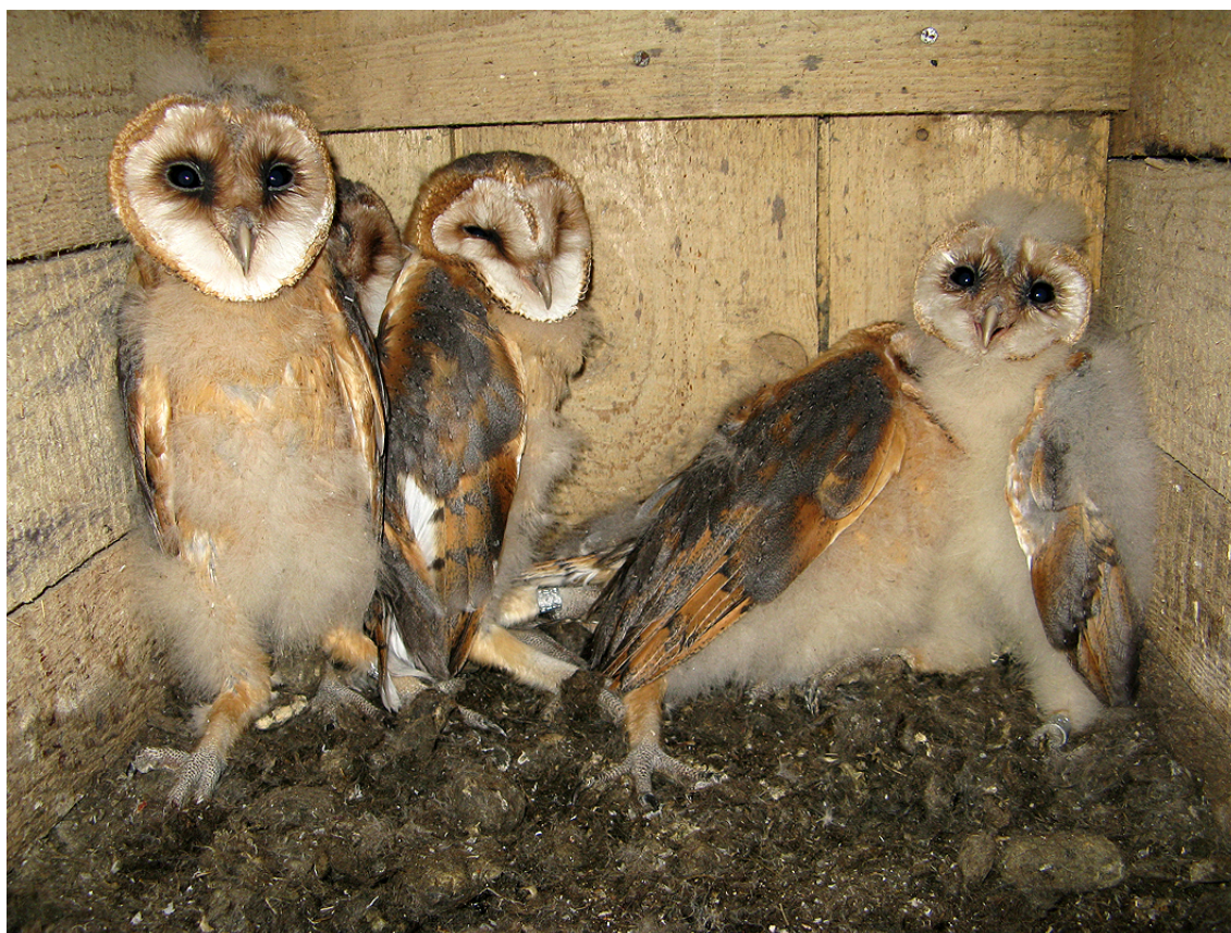
Mláďata sovy pálené ( Tyto alba ), Mory, okres Louny, 2010.