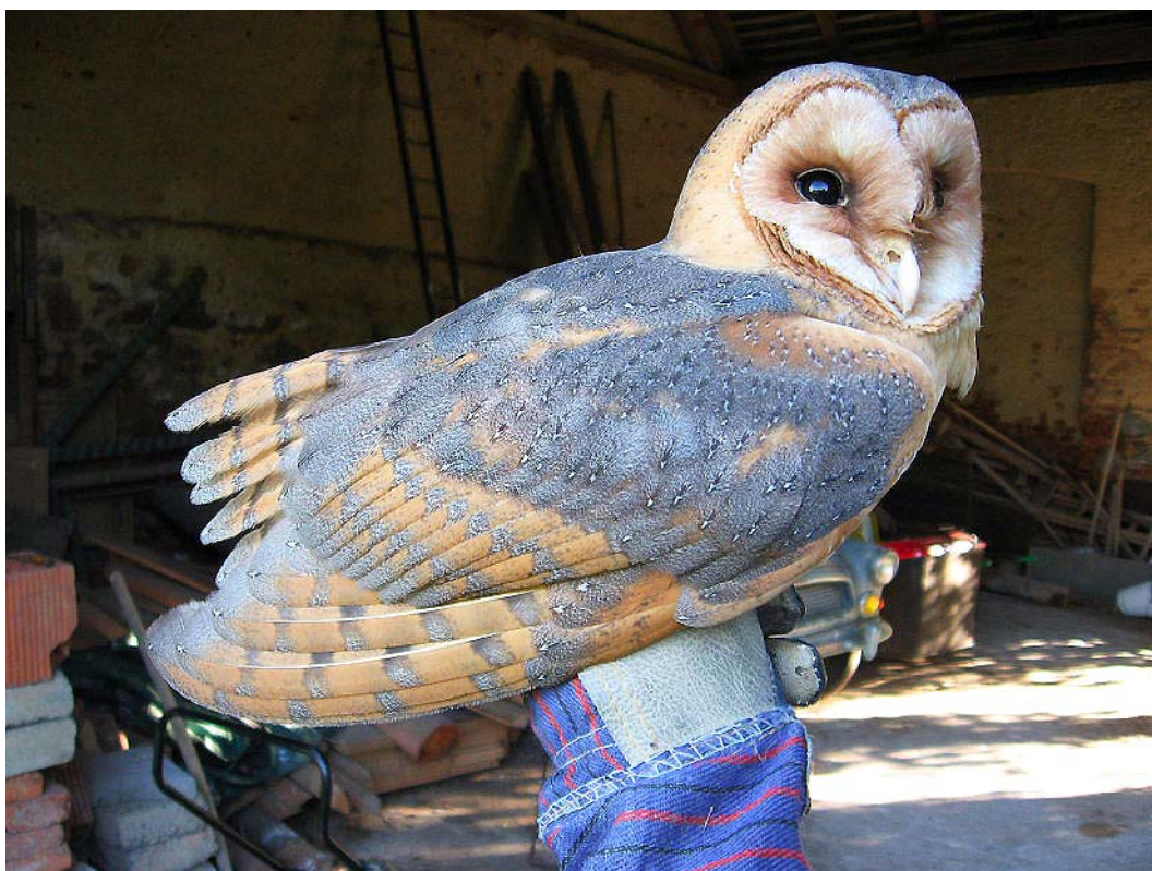
Adultní sova pálená ( Tyto alba ). Číňov, 2009.