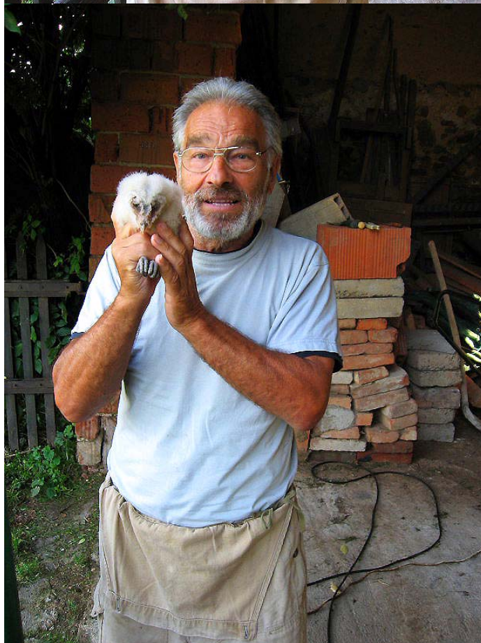
Osvěta ochrany sovy pálené u majitele objektu s budkou. Číňov, 2009.