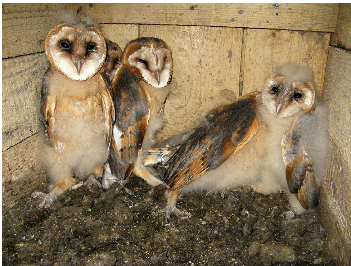
Mláďata sovy pálené ( Tyto alba ), Mory, okres Louny, 2010.